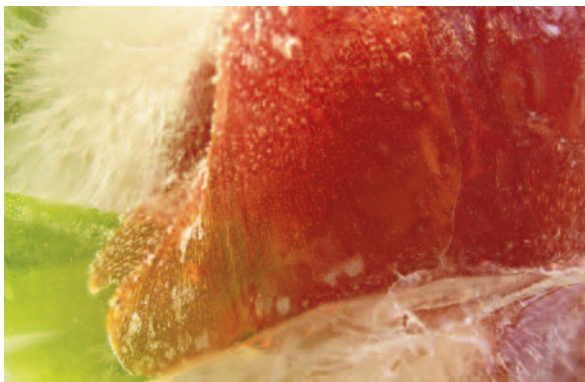
Theres Cassini, Glühend Eis_03 , 2008-12, Fine Art Print auf Plexiglas, PLEXIGLAS EindLighten gefräst, LED, Metallverbindungen, 43 x 59 x 8 cm, 2 Schichten

La mostra presenta in sette stanze e nello spazio della Burgkapelle dell'MMKK (Museo d'Arte Moderna della Carinzia) i lavori di 16 artisti contemporanei, che si rivolgono alla tematica della natura morta con espedienti e quesiti attuali, riuscendo a descriverla in maniera sorprendentemente poliedrica. Ciò dimostra che la natura morta – un genere che vanta una storia lunga quanto variegata – rappresenta evidentemente ancora oggi per gli artisti un ambito interessante che, proprio per la continuità ed il denso simbolismo che lo caratterizzano, si presta come ideale punto di partenza per un rinnovo contenutistico ed un ampliamento del suo spettro di significati.