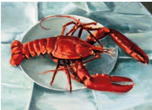
Alex Amann, o. T., 2012/13, Öl auf Leinwand, 41 x 59 cm

V Koroškem muzeju moderne umetnosti so na razstavi v sedmih prostorih in v razstavnem prostoru Burgkapelle predstavljena dela 16 sodobnih umetnic in umetnikov, ki s sodobnimi sredstvi in aktualnimi problematikami pristopajo k tematiki tihožitja in jo opisujejo s presenetljivo raznolikostjo. To dokazuje, da se tihožitje – zvrst z dolgo in pestro zgodovino – umetnikom očitno še vedno zdi zanimivo področje ter da sta njegova kontinuiteta in močna simbolika hkrati idealna povezujoča dejavnika za nov vsebinski naboj in širjenje njegovega pomenskega obsega.