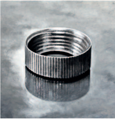
Richard Kaplenig, 25 mm, 2014, Öl auf Papier auf Leinwand, 200 x 200 cm

Die Ausstellung versammelt in sieben Räumen sowie in der Burgkapelle des MMKK Arbeiten von 16 zeitgenössischen Künstlerinnen und Künstlern, die sich mit gegenwärtigen Mitteln und aktuellen Fragestellungen der Thematik des Stillebens annähern und in einer überraschenden Vielfalt das nämliche Thema beschreiben. Diese bezeugt, dass das Stilleben – eine Gattung mit langer und abwechslungsreicher Geschichte – offensichtlich immer noch ein interessantes Betätigungsfeld für die Kunstschaffenden ist und dass seine Kontinuität und starke Symbolik sich geradezu als ideale Anknüpfungspunkte für eine neue inhaltliche Aufladung und Ausweitung seines Bedeutungsradius darstellen.